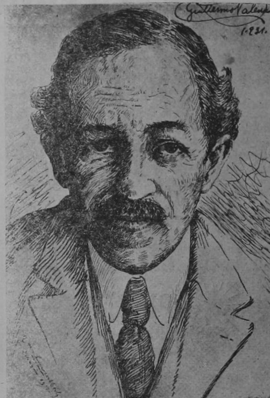
GUILLERMO VALENCIA Retrato a pluma de Max. v. Loewenthal

El dispendioso traslado de cuadros hasta Popayán (Colombia), me ha retardado el placer de contemplar directamente algo de la obra pictórica del célebre artista austriaco Maximilian Von Loewenthal, pero en cambio, lo he conocido a él—hasta donde puede serlo en breves charlas—un espíritu tan facetado como el suyo. Es difícil encontrar mayor dinamismo intelectual, mayor perspicacia en la visión, (Loewenthal no mira, diseña); ni inteligencia más comprensiva, ni más hospitalario talento de asimilación; todo ello servido por un extenso dominio de la vida a través de medios refinados o bárbaros, y de una deliciosa ironía, fina y urticante no más, como de persona bien nacida que sólo puede vivir dentro de una atmósfera de elegancia.